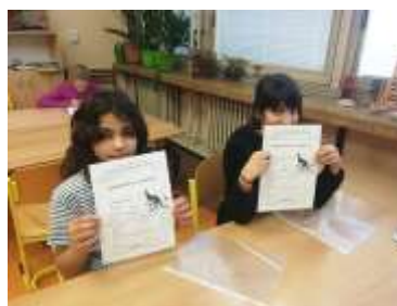
Žáci 3.,4. a 5.ročníku